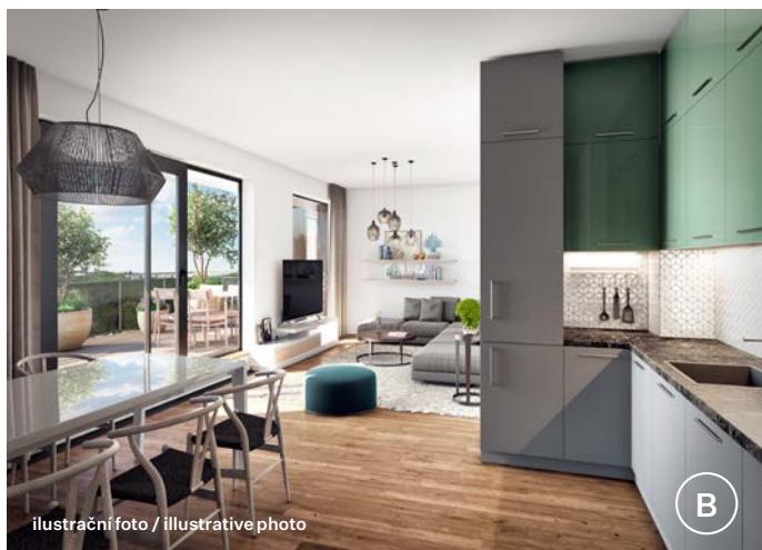
ilustrační foto / illustrative photo