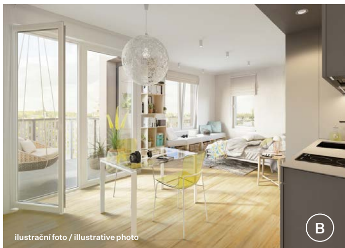
ilustrační foto / illustrative photo